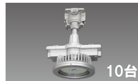
防爆形LED照明器具 高天井形 直付形 DRGE13H01(TB)S/N-PJ8 平均消費電力:92W