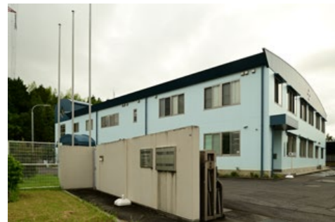
甲賀協同ガス株式会社 滋賀県甲賀市水口町ひのきが丘12